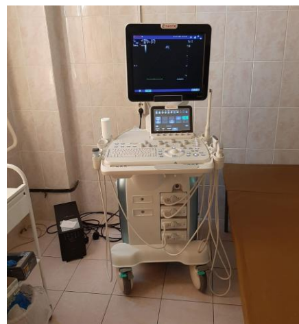
УЗИ – аппарат экспертного класса «MyLad Twise»