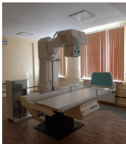
Рентгенодиагностический комплекс на 3 рабочих места «РЕНЕКС»

2019 год → 63 единицы оборудования поставлены в ООД г. Пенза на сумму 379,9 тыс.руб., в том числе тяжелое оборудование