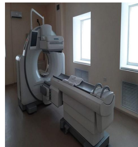
Система комбинированная однофотонной эмиссионной и рентгеновской компьютерной томографии Simbia Intevo Bold