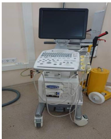
Гамма - терапевтический аппарат контактного облучения «SagiNova»